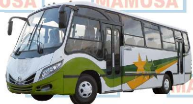
HINO 500 BUS